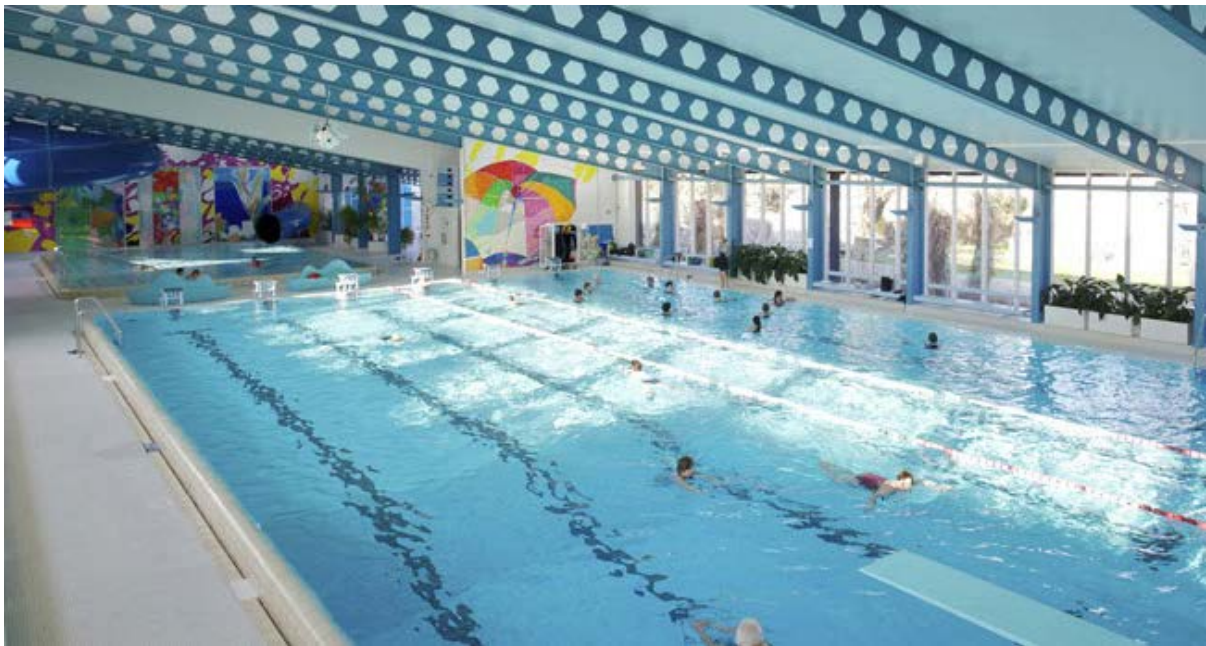
Abbildung 1: Hallenbäder sind grosse Strom- und Wärmeverbraucher

Der Stromverbrauch der Hallenbäder in der Schweiz war bisher noch nicht bekannt. In dieser Studie konnte nun aufgezeigt werden, dass der Stromverbrauch der Hallenbäder bisher unterschätzt wurde und beträchtlich ist. Denn die Hallenbäder brauchen etwa ähnlich viel Strom wie alle kommunalen Schulen in der Schweiz und verfügen über ein ähnlich grosses Sparpotenzial wie etwa die Kläranlagen oder Wasserversorgungen in der Schweiz.